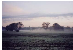
Morgenstimmungen an der Saale - aus unserem Archiv.